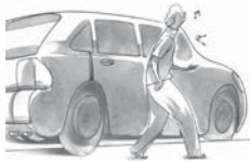
El coche está mal aparcado.