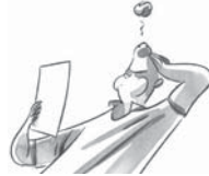
Es problema es muy difícil.