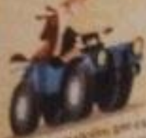
Бороздочный трактор для вспашки и выравнивания почвы.

Самый маленький трактор в мире. Он может работать на высоте 10 метров. Это самый маленький трактор в мире.