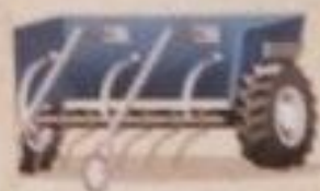
Плуг с лемехом

Плуг переворачивает землю, чтобы подготовить ее для посева семян.