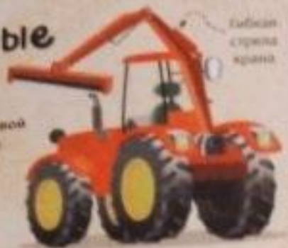
Гибкая стрела крана

Машина для подрезания живой изгороди из гибкой стрелы. Такая машина может стрелы высотой до 4,5 метра.