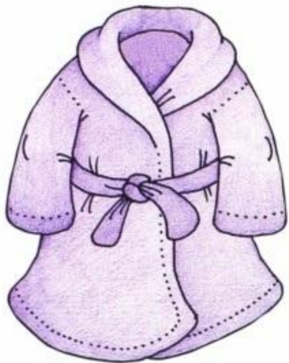
Халат. После ванны согреть тебя рад.