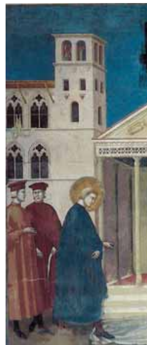
S. Francesco d'Assisi in un affresco di Giotto

Al cor gentil rempaira sempre, Amore com'a selva augello in la verdura né fe' Amor anzi che gentile cor né gentil core anzi ch'Amor. [...] strofa 1