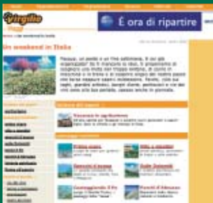
www.virgilio.it → VIAGGI